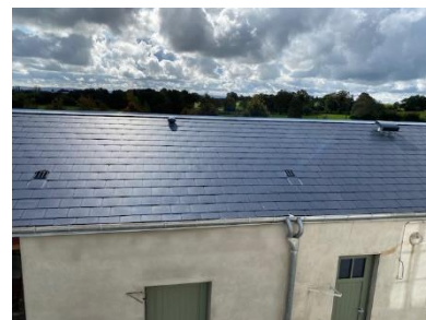
La nouvelle toiture avec l'aération du bloc sanitaire et l'extracteur de la cuisine