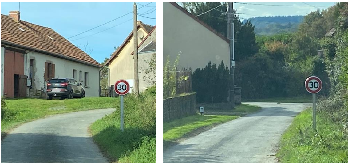
Panneaux de limitation de vitesse à 30km/h – entrées Sud et Nord de Grospaud

Nous avons également installé des panneaux imposant une vitesse maximale de 30km/h aux véhicules traversant le hameau de Grospaud. Un panneau supplémentaire sera d'ailleurs ajouté prochainement en amont de celui déjà en place à l'entrée nord du hameau de façon à englober dans cette restriction de vitesse toutes les habitations, même les plus éloignées. Le panneau existant deviendra ainsi un rappel de la limitation de vitesse en vigueur à Grospaud.