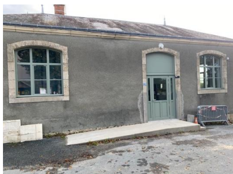
Les nouvelles fenêtres et la nouvelle porte